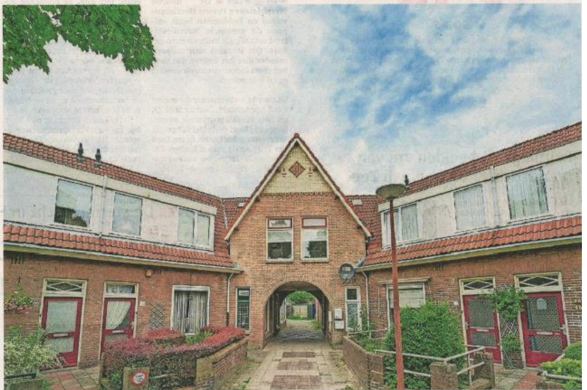
Bloemwijk anno nu.